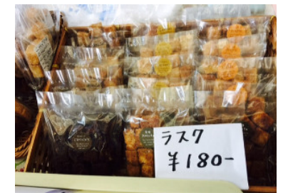
看板商品のふすまラスク