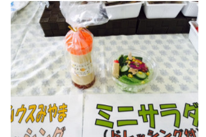
キッチンの自家製ドレッシング