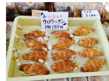
新作！ふすまクロワッサン