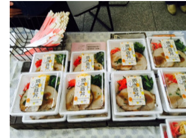
人気の自家製焼豚丼