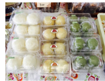
春の饅頭のふき味噌とよもぎ