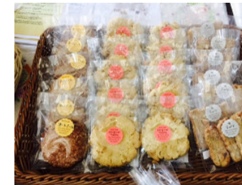
種類も豊富なふすま入りクッキー