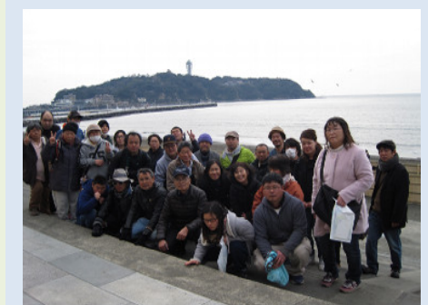
江ノ島をバックに！