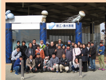
新江ノ島水族館にて