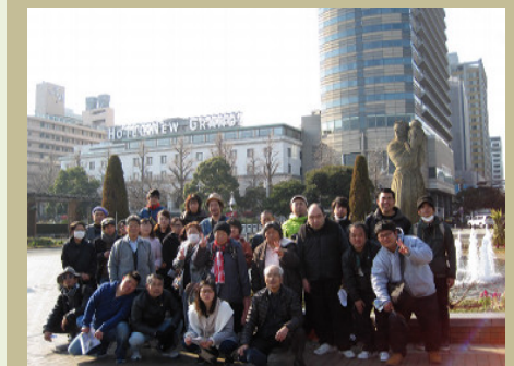
宿泊したホテルニューグランドをバックに