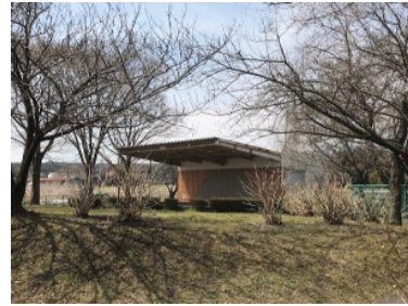
ふるさと公園の野外ステージ