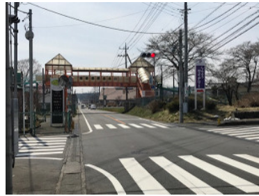
ふるさと公園のシボルの歩道橋

製菓製パン事業「麦のゆめ」は、榛東村へ新たな福祉サービス事業所として、6月1日(金)の開設を目指し、準備中です。榛東村ふるさと公園内にある旧 JA 農畜産物直売所の建物を、新事業所に改修工事も急ピッチで進んでおり、ゴールデンウィーク後には工事を終了し、厨房設備も引っ越しする予定です。開設まで2ヵ月を切り、福祉サービス開始の申請書類の準備など慌ただしい毎日が続いています。