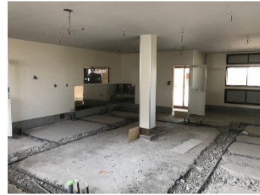
改装中の麦のゆめの新厨房

過日、榛東ふるさと公園周辺施設活性化委員会が榛東村役場の会議室で開かれ、「麦のゆめ」も委員として参加させて頂きました。この委員会では、榛東村の担当職員の方や地区の役員さん、榛東ふるさと公園周辺の施設の方々が集まり、公園の活性化や毎年、春と夏に行われる公園のおまつりなどについて検討をしています。「麦のゆめ」も、今後は委員会の一員として、公園の集客につながる様々なアイデアや公園を利用する方々の声を届け、公園の活性化のお手伝いをして行きたいと思います。