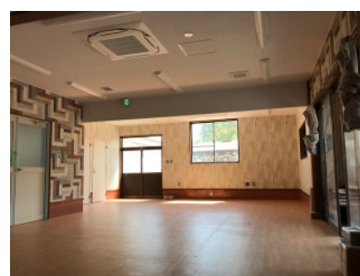
日当たりのいい事務スペース