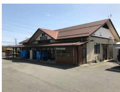
旧 JA 農畜産物直売所をお借りします

障害者福祉サービス事業所「麦のゆめ」の開所まで1ヵ月を切りました。ゴールデンウィーク明けには改修工事も終わり、引っ越しが始まります。特に5月14日から製菓製パンの厨房設備を移設し、製造が再開できるのは5月24日頃になります。日頃より、「麦のゆめ」のパンやお饅頭をご愛顧頂いていますお客様には商品の供給がストップするなどご迷惑をお掛けいたしますが、ご理解とご協力をお願いします。6月1日からは、新たな事業所として榛東ふるさと公園の中にて営業を開始しますので、引続きのご愛顧よろしくお願ひ致します。