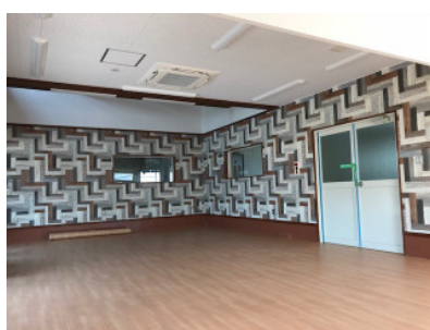
お洒落な壁紙が張られた多目的室