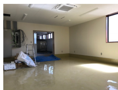
広々とした包装室もあります