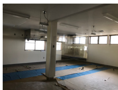
これから厨房機器が移設される菓子厨房