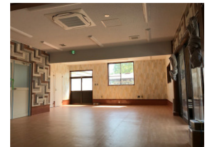
日当たりのいい事務スペース