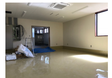
広々とした包装室もあります