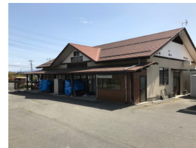
旧 JA 農畜産物直売所をお借りします

障害者福祉サービス事業所「麦のゆめ」の開所まで1ヵ月を切りました。ゴールデンウィーク明けには改修工事も終わり、引っ越しが始まります。特に5月14日から製菓製パンの厨房設備を移設し、製造が再開できるのは5月24日頃になります。日頃より、「麦のゆめ」のパンやお饅頭をご愛顧頂いていますお客様には商品の供給がストップするなどご迷惑をお掛けいたしますが、ご理解とご協力をお願いします。6月1日からは、新たな事業所として榛東ふるさと公園の中にて営業を開始しますので、引続きのご愛顧よろしくお願い致します。