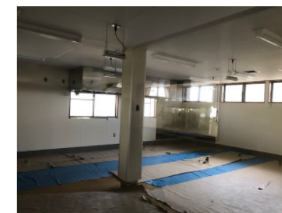
これから厨房機器が移設される菓子厨房