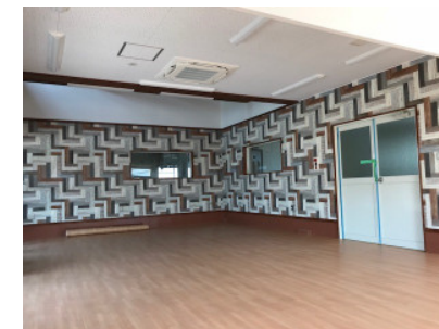
お洒落な壁紙が張られた多目的室