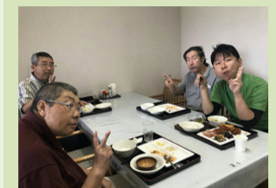
楽しいバイキングランチ