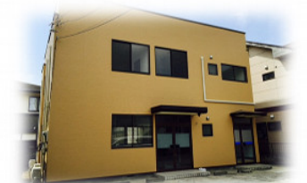
ワークハウスみやま