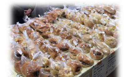
麦のゆめ(製菓製パン)