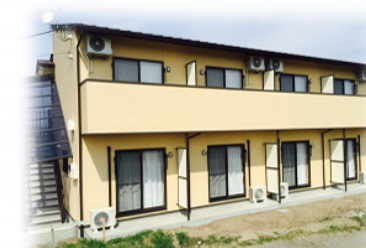
グループホーム (ハーモニーやまなみ)

給付金収入 32,865,513 円 前年対比(+1.6%) 人件費 31,654,865 円 前年対比(+6.2%) 一般管理費 3,787,034 円 前年対比(+42.7%)