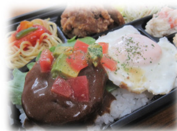
キッチンハウスみやま(宅配弁当)