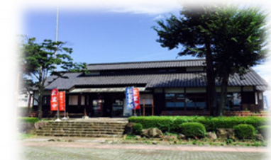
しんとうふるさと公園

給付金収入 12,828,120 円 人件費 21,687,000 円 一般管理費 4,301,902 円