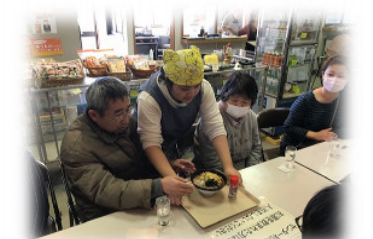
中川長寿センター売店