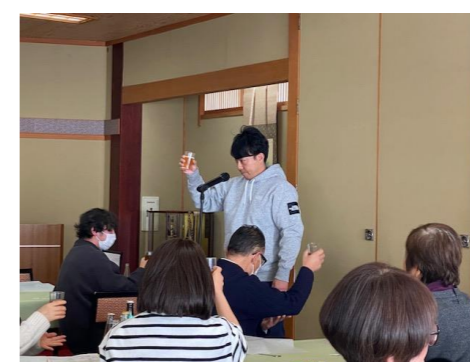
理事さんによる乾杯のご発声