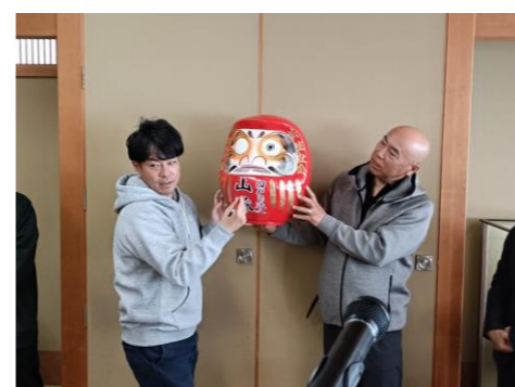
今年の縁起達磨には願掛けの片目が