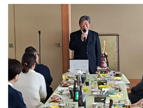
監事さんにメのお言葉を頂きました