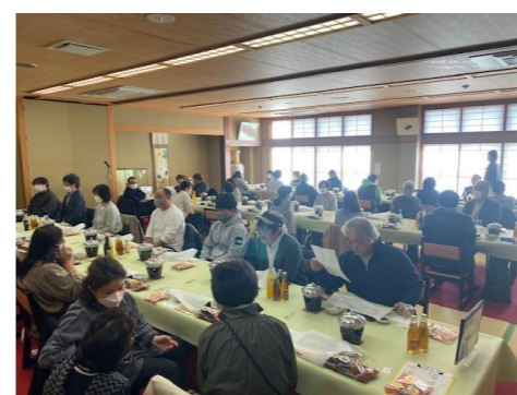
今年も役職員が一同に会しました