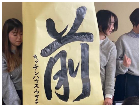
キッチンハウスみやま