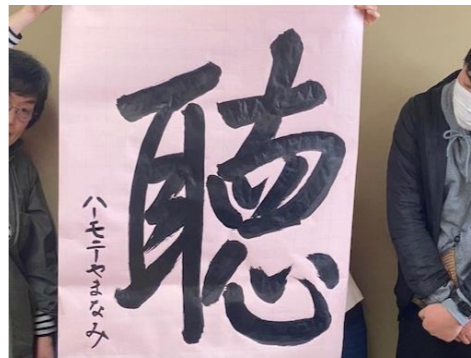
ハーモニーやまなみ