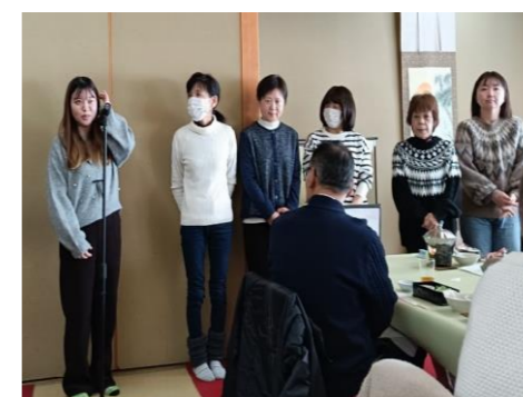
今年度、入職された職員の紹介