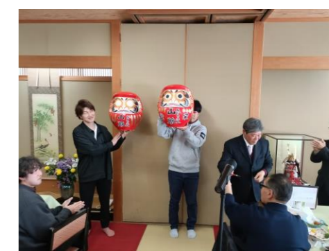
昨年の縁起達磨に両目が入りました