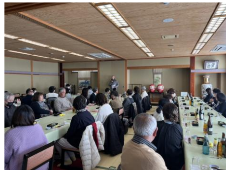
役職員が一同に会しました

山脈の新年会は、役員の挨拶、新人職員の紹介、令和8年の抱負や目標を表す漢字一文字の発表、感謝の言葉の紹介、縁起達磨の目入れ、そして、お楽しみお年玉抽選会などのプログラムがあります。今年も、美味しい食事を囲みながら大いに職員交流を図りました。