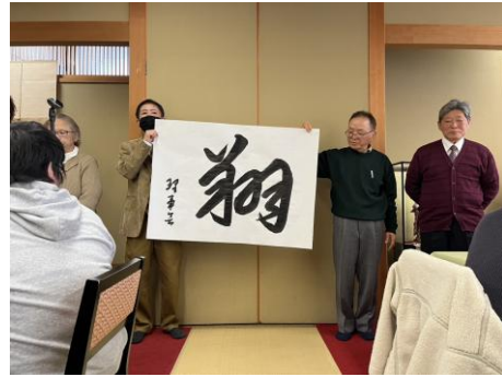
今年の漢字一文字の発表