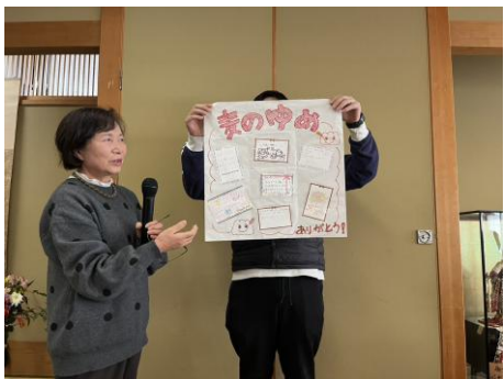
感謝の言葉の発表