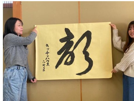
キッチンハウスみやま「声」