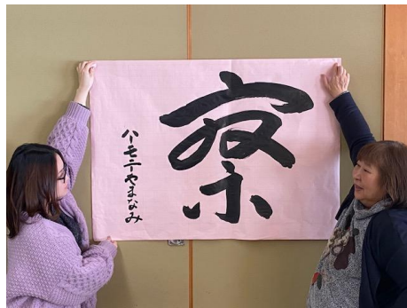
ハーモニーやまなみ「察」