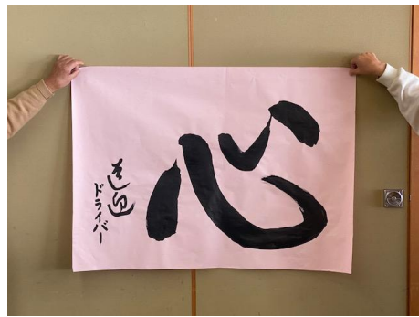
送迎ドライバー「心」